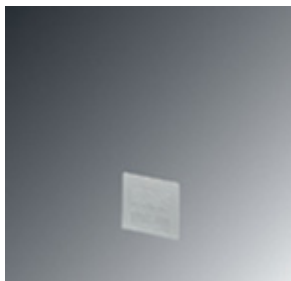
Abschlussdeckel, Länge: 28 mm, Breite: 1 mm, Höhe: 26,2 mm, Farbe: grau

Bitte beachten Sie, dass die hier angegebenen Daten dem Online-Katalog entnommen sind. Die vollständigen Informationen und Daten entnehmen Sie bitte der Anwenderdokumentation. Es gelten die Allgemeinen Nutzungsbedingungen für Internet-Downloads. ( http://phoenixcontact.de/download )