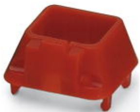
Security-Rahmen für SFN Switch und Patchfelder, rot

Bitte beachten Sie, dass die hier angegebenen Daten dem Online-Katalog entnommen sind. Die vollständigen Informationen und Daten entnehmen Sie bitte der Anwenderdokumentation. Es gelten die Allgemeinen Nutzungsbedingungen für Internet-Downloads. ( http://phoenixcontact.de/download )