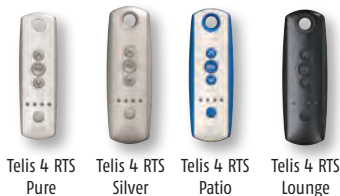
Telis 4 RTS Pure Telis 4 RTS Silver Telis 4 RTS Patio Telis 4 RTS Lounge

Manuelle Steuerung eines oder mehrerer RTS-Funkantriebe / RTS-Funkempfänger per Funk.