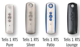
Telis 1 RTS Pure Telis 1 RTS Silver Telis 1 RTS Patio Telis 1 RTS Lounge