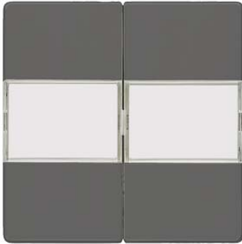
I-SYSTEM, CARBONMETALLIC WIPPE MIT SCHILD F.SERIEN/DOPPEL-WECHSELSCHALTER 55X55MM