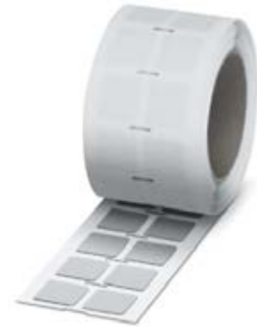
Abbildung zeigt ähnlichen Artikel

http://eshop.phoenixcontact.at/phoenix/treeViewClick.do?UID=0802728