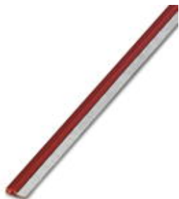
Endlossteckbrücke, Länge: 500 mm, Farbe: rot

Bitte beachten Sie, dass die hier angegebenen Daten dem Online-Katalog entnommen sind. Die vollständigen Informationen und Daten entnehmen Sie bitte der Anwenderdokumentation. Es gelten die Allgemeinen Nutzungsbedingungen für Internet-Downloads. ( http://phoenixcontact.de/download )