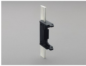
03163 Trennmesser 400 A Größe 2