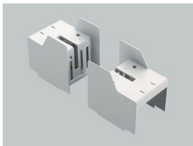
03794 Berührungsschutz 2-teilig für NH-Unterteil Größe 3