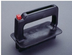
03502 NH-Aufsteckgriff ohne Stulpe Größe 000 - 3