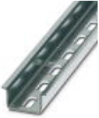
Tragschiene 35 mm (NS 35)

Tragschiene gelocht - NS 35/15 WH PERF 2000MM - 0806602