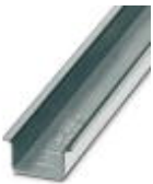
Tragschiene 35 mm (NS 35)

Tragschiene - NS 35/15 WH UNPERF 2000MM - 1204135