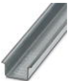
Tragschiene, Material: verzinkt, ungelocht, Höhe 15 mm, Breite 35 mm, Länge: 2 m

Tragschiene ungelocht - NS 35/15 ZN UNPERF 2000MM - 1206586