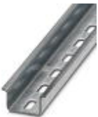
Tragschiene, Material: verzinkt, gelocht, Höhe 15 mm, Breite 35 mm, Länge: 2 m

Tragschiene gelocht - NS 35/15 ZN PERF 2000MM - 1206599