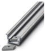
Tragschiene, profil-gezogen, hohe Ausführung, ungelocht 1,5 mm dick, Material: Aluminium, Höhe 15 mm, Breite 35 mm, Länge 2000 mm

Tragschiene ungelocht - NS 35/15 AL UNPERF 2000MM - 1201756