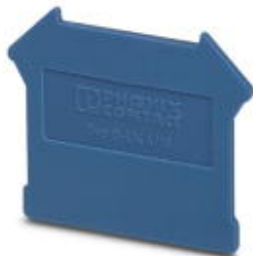
Abschlussdeckel, Länge: 42,5 mm, Breite: 1,8 mm, Höhe: 47 mm, Farbe: blau

Bitte beachten Sie, dass die hier angegebenen Daten dem Online-Katalog entnommen sind. Die vollständigen Informationen und Daten entnehmen Sie bitte der Anwenderdokumentation. Es gelten die Allgemeinen Nutzungsbedingungen für Internet-Downloads. ( http://phoenixcontact.de/download )