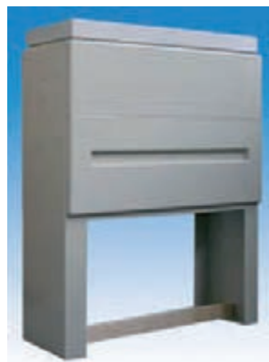
Sockel mit Zwischenrahmen