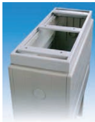
Sockel mit Zwischenrahmen