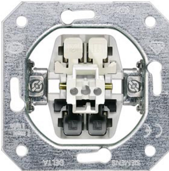
DELTA SCHALTER-GERÄTEEINSATZ UP, AUSSCHALTER 2POLIG 16A 250V