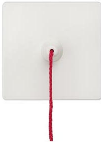
I-SYSTEM WIPPE MIT ZUGBETAETIGUNG FUER TASTER TITANWEISS, 55X55MM