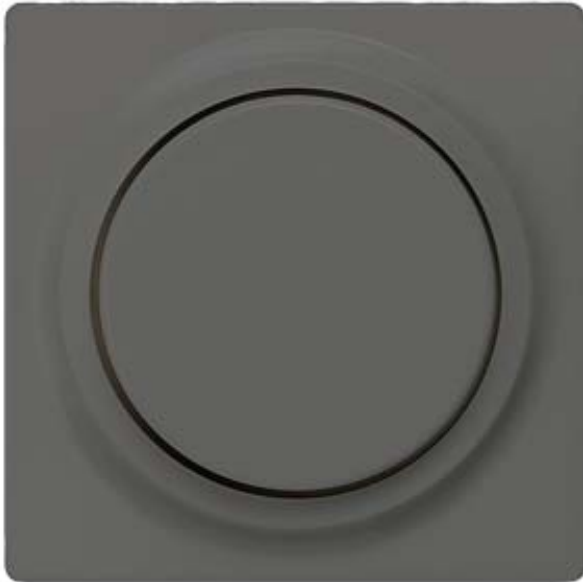
I-SYSTEM, CARBONMETALLIC ABDECKPLATTE FUER DIMMER MIT DREHKNOPF 55X55MM