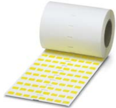
Abbildung zeigt die Produktvariante EML (20X8)R YE

http://eshop.phoenixcontact.at/phoenix/treeViewClick.do?UID=0819288