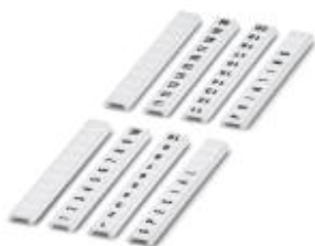
Zackband flach, 10-teilig, längs bedruckt mit den fortlaufenden Zahlen: 101 ... 110, weiß

Bitte beachten Sie, dass die hier angegebenen Daten dem Online-Katalog entnommen sind. Die vollständigen Informationen und Daten entnehmen Sie bitte der Anwenderdokumentation. Es gelten die Allgemeinen Nutzungsbedingungen für Internet-Downloads. ( http://phoenixcontact.de/download )