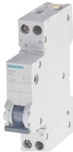
LEITUNGSSCHUTZSCHALTER 230V 6KA, 1+N-POLIG/1TE, B 13A