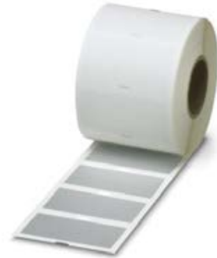
Abbildung zeigt Variante des Artikels

http://eshop.phoenixcontact.at/phoenix/treeViewClick.do?UID=0800350