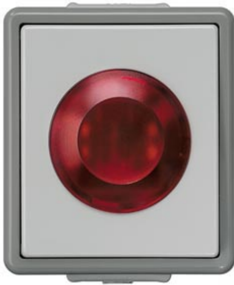
DELTA FLAECHE IP44, AP LICHSIGNAL 250V MIT GLIMMLAMPE, 66X75MM