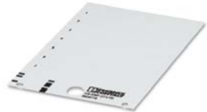
Abbildung zeigt eine Variante des Artikels

http://eshop.phoenixcontact.at/phoenix/treeViewClick.do?UID=0828775