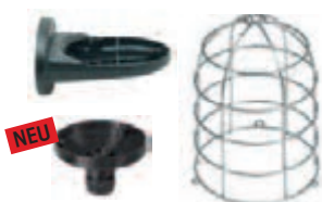
Kunststoffwinkel, Rohradapter und Drahtschutzkorb (Zubehör)