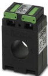
Rohrstabstromwandler, Primärstrom 50 A AC; Sekundärstrom 5 A AC; Genauigkeitsklasse 1; Bemessungsleistung 1,25 VA

Bitte beachten Sie, dass die hier angegebenen Daten dem Online-Katalog entnommen sind. Die vollständigen Informationen und Daten entnehmen Sie bitte der Anwenderdokumentation. Es gelten die Allgemeinen Nutzungsbedingungen für Internet-Downloads. ( http://phoenixcontact.de/download )