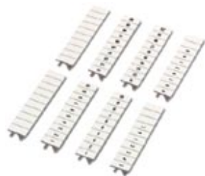
Zackband, 10-teilig, längs bedruckt mit den fortlaufenden Zahlen: 31 ... 40, weiß, Breite: 5 mm

Bitte beachten Sie, dass die hier angegebenen Daten dem Online-Katalog entnommen sind. Die vollständigen Informationen und Daten entnehmen Sie bitte der Anwenderdokumentation. Es gelten die Allgemeinen Nutzungsbedingungen für Internet-Downloads. ( http://phoenixcontact.de/download )