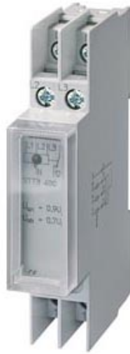
SPANNUNGSRELAIS T5570 AC 230/400V 1W 0,7/0,9 MIT KLARSICHTKAPPE