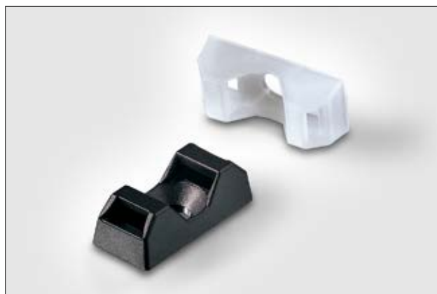
Q-Mount Befestigungssockel CTQM zum Schrauben.